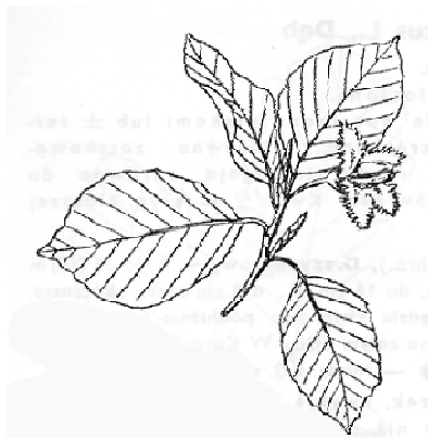
BUK (BUK ZWYCZAJNY)